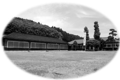
右側の建物(明治36年竣工)の屋根は、平成26年度日本郵便の年賀寄付金の助成を受けて改修しました。

● ゆうちょ銀行 記号番号 00160-9-535731 ● 加入者名 もうひとつの美術館